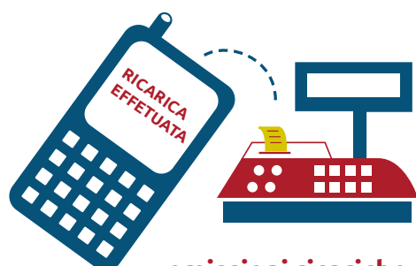
emissioni ricariche telefoniche