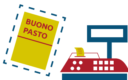
dematerializzazione buoni pasto cartacei